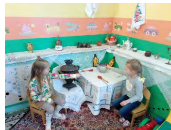
Мини –музей «Русская изба». «Жемчужина Дона».